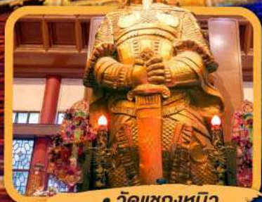
• วัดแซงกหมิว