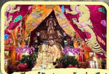
• เอียงบูซิว (ศาลเจ้าพ่อเสือ)