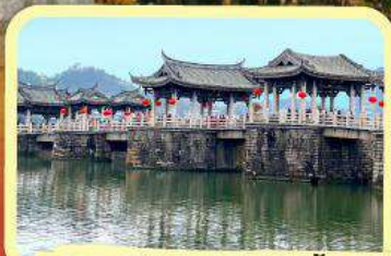
• สะพานโบราณกว่างจี