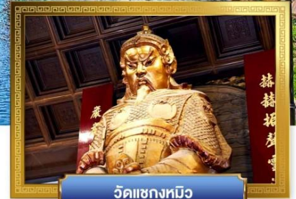
วัดเขangkหมิว