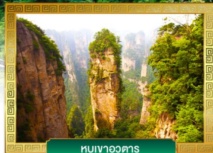
ภูเขาอวดดาว